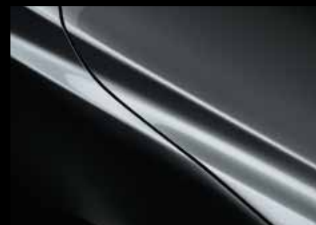
MACHINE GREY (46G)*