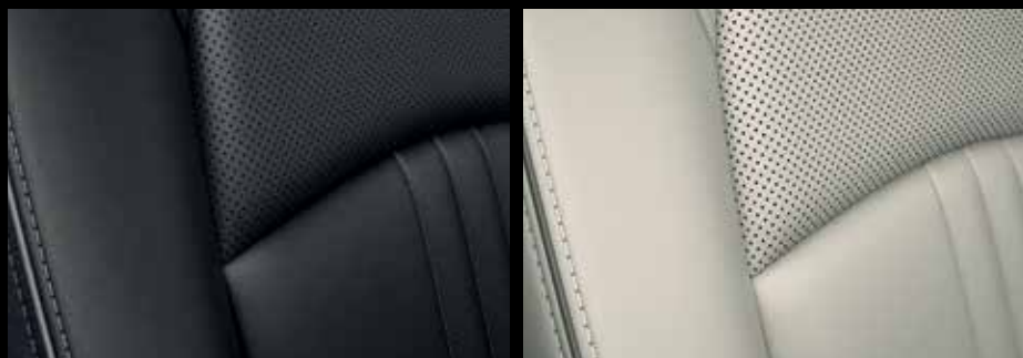
ZWART LEDEREN ZETELBEKLEDING MET CONTRASTERENDE STIK-NAAD (SKYCRUISE)