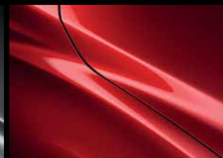
SOUL RED CRYSTAL (46V)*