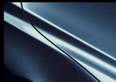
ETERNAL BLUE (45B)*