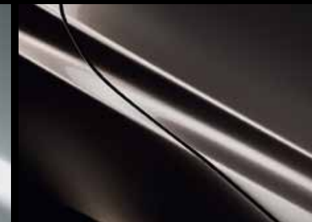
TITANIUM FLASH (42S)*