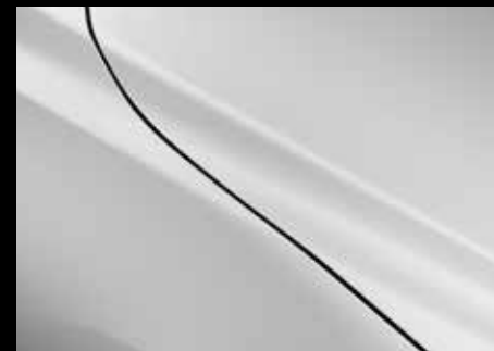
ARCTIC WHITE (A4D)