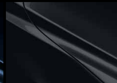
JET BLACK (41W)*