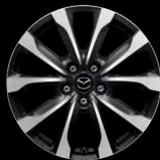
18" LICHTMETALEN VELGEN DIAMOND CUT 'SILVER/GUNMETAL'