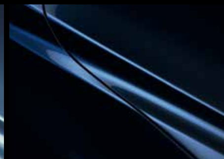
DEEP CRYSTAL BLUE (42M)*