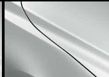
SNOWFLAKE WHITE (25D)*