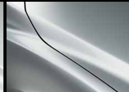
CERAMIC WHITE (47A)*