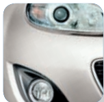
Crystal White Pearl Mica* (34K)