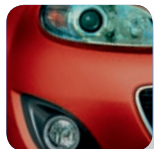
True Red (A4A)