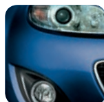
Stormy Blue Mica* (35J)