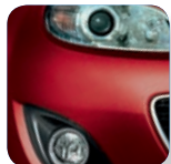
Copper Red Mica* (32V)