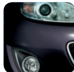
Brilliant Black (A3F)