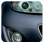
Metropolitan Grey Mica* (36C)