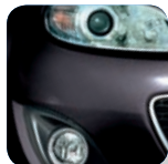
Sparkling Black Mica* (35N)