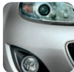
Aluminium Metallic* (38P)